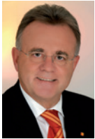
Landeshaupmann Hans Niessl

Mit dieser Broschüre möchten wir Ihnen einen Überblick über das Angebot im Öffentlichen Verkehr (ÖV) im Südburgenland bieten. Das Land Burgenland wendet im Jahr 2015 rund 17 Mio. Euro für abgestimmte und optimierte Angebote für die burgenländischen Pendlerinnen und Pendler auf. Damit werden Ticketpreise im ÖV gestützt, wurde die G1-Monatskarten-Aktion etabliert, der Ausbau von Park&Ride-Anlagen gefördert, die WIPARK-Garagenaktion in Wien umgesetzt und vieles mehr. Der Verkehrsverbund Ost-Region und die Mobilitätszentrale Burgenland sind dabei die zentralen Ansprechpartner, die auch für Sie gerne zur Verfügung stehen. Nutzen Sie diese Angebote und den ÖV im Burgenland!